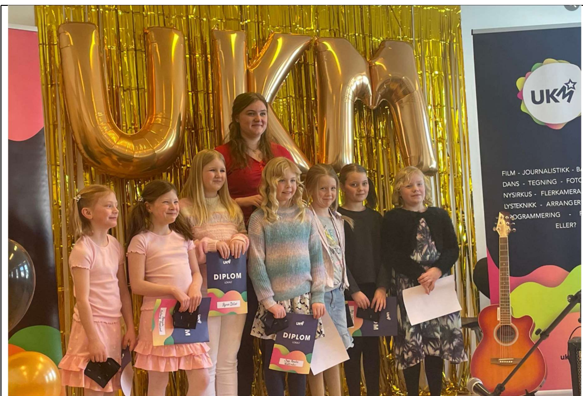
Lokal UKM-festival på Sørli skole i mars 2023.