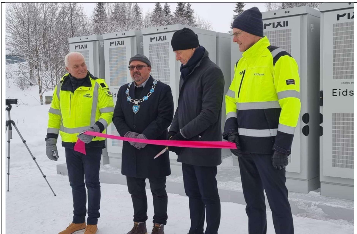
Energiminister Terje Aasland var innom Lierne kommune i forbindelse med åpning av en batteriløsning som skal piloteres på Jule industriområde.