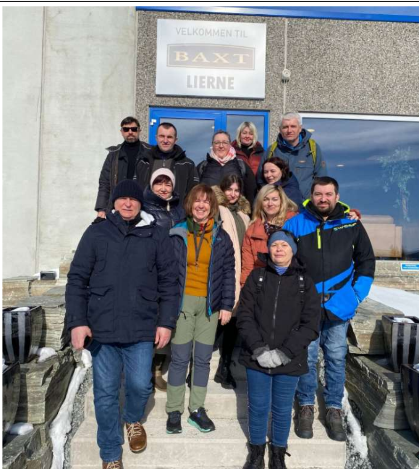
Lierne voksenopplæring på besøk til Baxt Lierne en vakker vårvinterdag i 2023.

Compilo benyttes som kommunens avvik- og internkontrollsystem. Det er fortsatt et mål å forbedre innhold og bruk av dette systemet, og få alle ansatte opp på samme kunnskapsnivå på dette systemet.