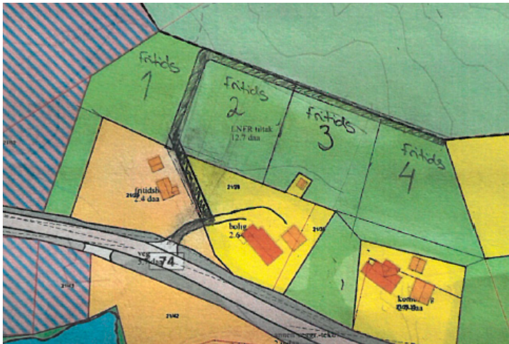
Figur 1. Viser innspillet med inntil 4 tomter med fritidsformål.

Kommunen vurderte at en slik endring ville ha medført at plansaken måtte ha vært sendt på ny høring før kommunen kunne ha godkjent planen. For å unngå forsinkelser for de næringsdrivende innenfor planområdet valgte kommunen å vedta planen slik den forelå, og behandle innspillet som et endringsforslag.