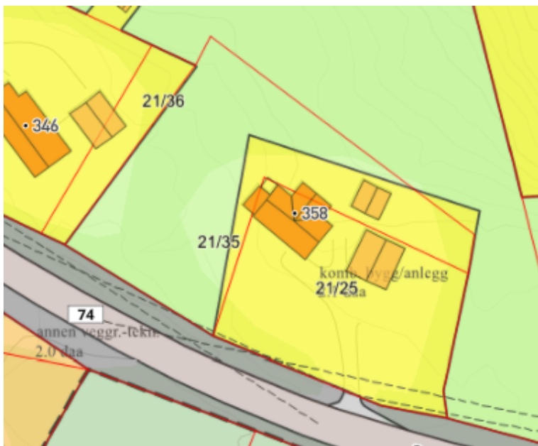
Figur 4. Viser arealformålet bolig i gjeldende reguleringsplan, for eiendommene 21/25 og 21/35.

Under avslutningsarbeidet med reguleringsplanen ble det oppdaget at det var feil i eierforholdene for 21/25 og 21/35. Dette er nå rettet i matrikkelen i samsvar med tidligere avtaler gjennom ny oppmåling. Det foreslås derfor å endre arealformålet boligformål til å være i samsvar med boligeiendom 21/25 og 21/35.