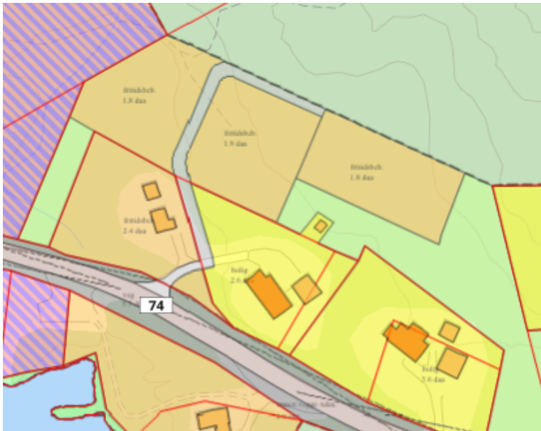
Figur 3. Viser det konkrete forslaget til endring, som er utarbeidet etter gjennomført befarings. I tillegg viser det det justerte arealet med boligformål, for eiendommene med 21/25 og 21/35.

Under avslutningsarbeidet med reguleringsplanen ble det oppdaget at det var feil i eierforholdene for 21/25 og 21/35. Dette er nå rettet i matrikkelen i samsvar med tidligere avtaler gjennom ny oppmåling. Det foreslås derfor å endre arealformålet boligformål til å være i samsvar med boligeiendom 21/25 og 21/35.